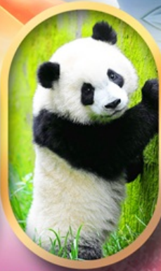
ศูนย์อนุรักษ์หนีแพนด้า