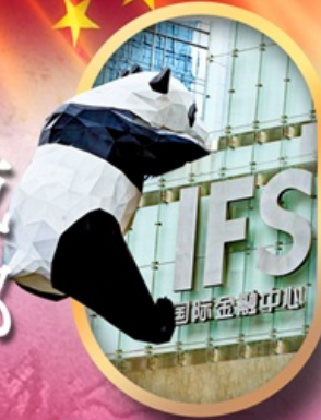
IFS หนีแพนด้าป็นตึก