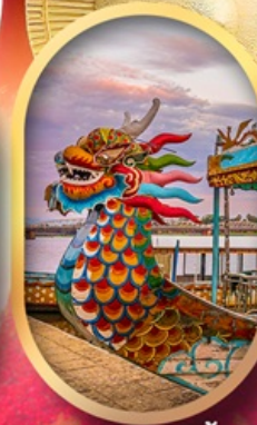
ล่องเรือมังกรแม่น้ำหอม