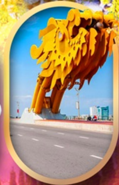
สะพานมังกรดานัง