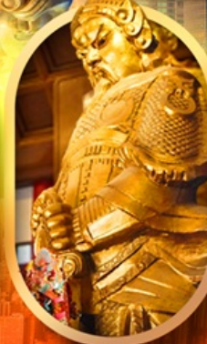
เทพวัดแซง

เที่ยว 2 ประเทศ 4 พอร์ วัดดัง ช้อปปิ้งจุใจ