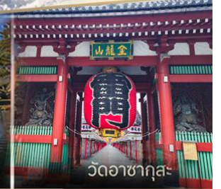
วัดวาทากุสะ