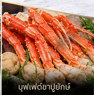
บุฟเฟ่ต์ซาปูยักซ์