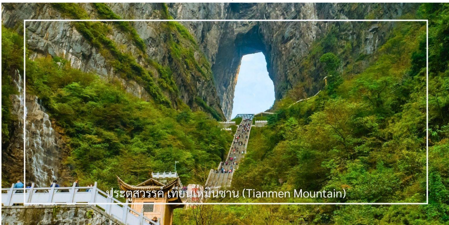
ประตูสวรรค์ เทียนเหมินซาน (Tianmen Mountain)

เสียดฟ้า เมื่อถึงยอดเขาเทียนเหมินซาน นำคณะเดินตามเส้นทางชมวิวเลียบบภูเขาและหน้าผา ชมทัศนียภาพจากมุมสูงบนยอดเขา ทำท่ายความกล้าของท่านด้วยการเดินบนพื้นกระจกใสของ ระเบียงแก้ว กระจกใสเลียบบหน้าผา จากนั้นนำท่านสู่ ประตูสวรรค์ โดย บันไดเลื่อนที่สร้างขึ้นโดยการเจาะทะลุภูเขาที่เรียงติดต่อกันถึง 5 ตอน เป็นเครื่องอำนวยความสะดวกใหม่ล่าสุดของ เขาเทียนเหมินซาน ท่านจะได้ถ่ายภาพ ประตูสวรรค์ อย่างใกล้ชิด