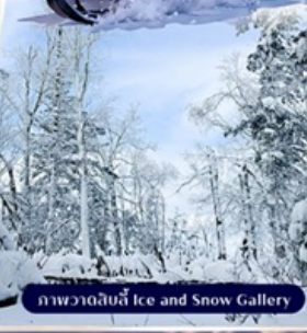
ภาพวาดด้วยน้ำแข็ง Ice and Snow Gallery