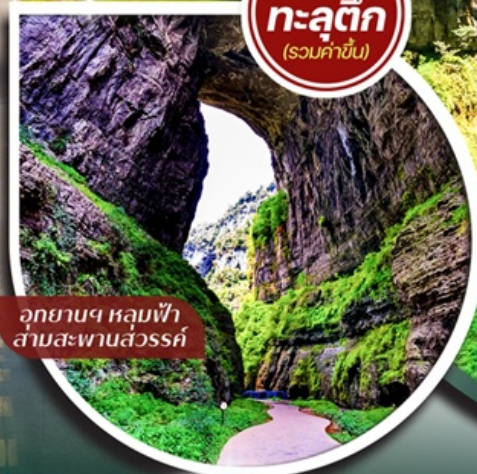
อุทยานฯ หลุมฟ้า สามสะพานสวรรค์