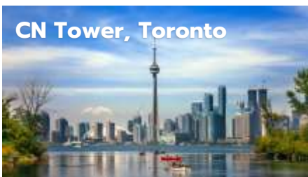
CN Tower, Toronto