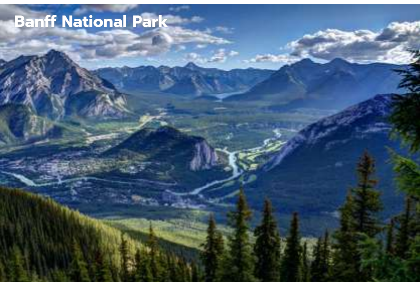
Banff National Park