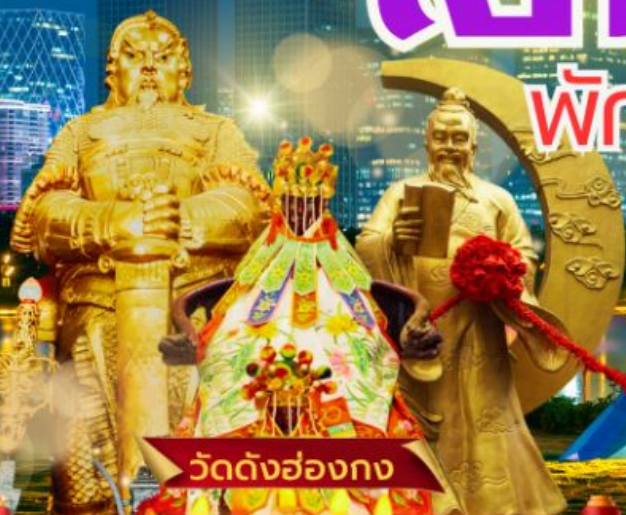
วัดดั่งฮ่องกง