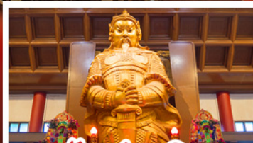
วัดซ่งกวงหมิว