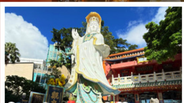
เจ้าแม่กวนอิมรัฟส์เบย์