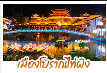
เมืองโบราณที่งดงาม