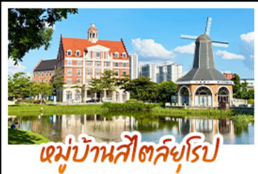
หมู่บ้านสไตล์ยุโรป

ล่องเรือชมดอกไม้สีขาวบานเหนือสายน้ำ ณ เมืองต๋อเทียนสวยสดงดงามหนึ่งปีมีหนึ่งครั้ง ถ่ายรูปเช็คอินแบบชิคๆ ณ หมู่บ้านสไตล์ยุโรป • ชม UNSEEN แห่งป่าชุ่มน้ำ ล่องเรือชมทะเลในห้า ถ้ำ ชมเหมินไห่ เหมือนแดนสวรรค์ • ชมน้ำพุร้อนฟ้า ที่ท่องเที่ยวระดับ 4A • ชมความอลังการของ น้ำตกสองแผ่นดิน จีน-เวียดนาม ณ เต๋อเทียน • ถ้ำน้ำแข็งหลงกิงกับประติมากรรมน้ำแข็งสวยงาม และอากาศดีตลอด • ชมดอกไม้ตามฤดูกาล ณ ภูเขาชิง พร้อชมพระเจ้าน้ำร้อนอิมพินกร