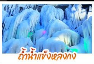
ถ้ำน้ำแข็งหลงกง