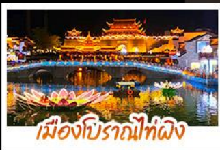
เมืองโบราณที่ผิง