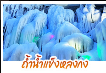
ถ้ำน้ำแข็งหลงกิง