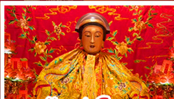
วัดเล่งโง้ว