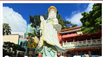
เจ้าแม่กวนอิมรัฟส์เบย์