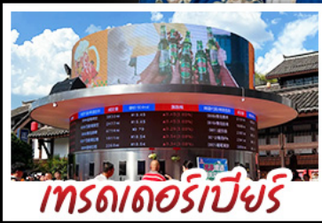
เทรดเดอร์เบียร์