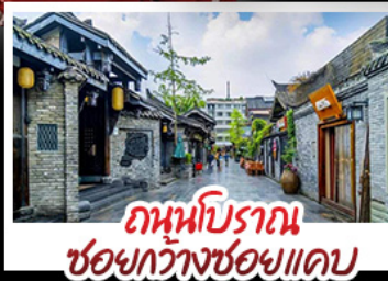
ถนนโบราณ ชอยกว้างชอยแคบ