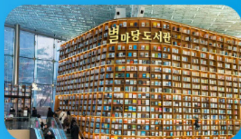
ต้องสมุดสตาร์ฟิลา