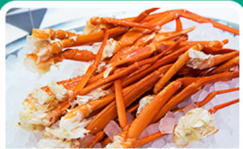
พิเศษ! บุฟเฟ่ต์ขาปู