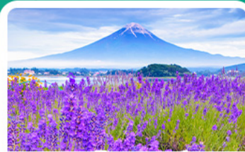
สวนโออิชิพาร์ค