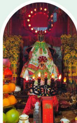
วัดเจ้าแม่กวนอิมอองฮำ