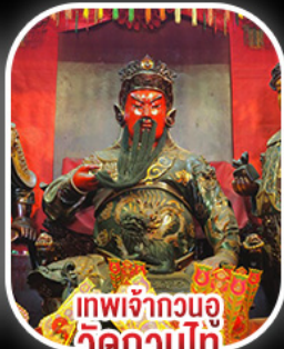
เทพเจ้ากวนอู วัดกวนโท