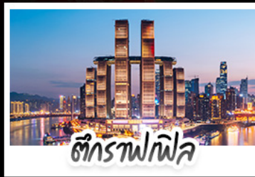
ตึกรางฟลิค