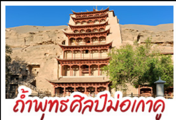
กำแพงพุทธศิลป์มอเกาคุ

มินิพระราชวัง - สระน้ำวงพระจันทร์ ทะเลสาบเกลือฉางซ่า - กำแพงพุทธศิลป์มอเกาคุ หุบเขาสายรุ้งจางเย่ - ทะเลสาบชิงไห่