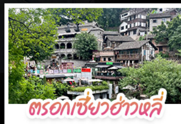
ตรอกเซี่ยวฮ่าวเสี