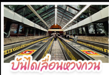
บันไดเลื่อนแขวงทวน