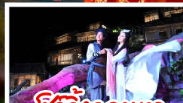
ชีวิตจิ้งจอกขาว