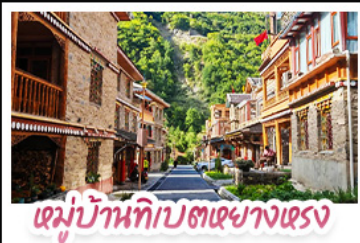
หมู่บ้านทิเบตเขียงตรง

ตะลุยเจ็ดคูหิมะต้ากู่ปิงชาน ชวนเซ็กคินแพนด้ายักษ์ พักใจที่หยดน้ำดาสีฟ้า! แวะชิลเมืองโบราณลี่ตี้ สัมผัสมนต์เสน่ห์ หมู่บ้านทิเบตหยางหงฮาต่อ สัมผัสความหนาวเย็นที่ อู๋ชานสวรรค์ธารน้ำแข็งต้ากู่ปิงชาน แหล่งรวมวิวหลักล้าน ตื่นตาไปกับแสงสียามค่ำคิน หยดน้ำดาสีฟ้า ณ สะพานหนานเฉียว เมืองตุ๋จิงเจียง ก่อนปิดท้ายด้วยการช้อปปิ้งจุใจ ถนนชุนซีลู่-ไท่กู่หลี่ และเซะภาพกับ แพนด้าเซลฟี สุดคิวท์