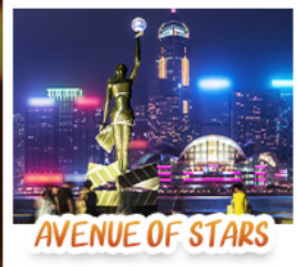
AVENUE OF STARS