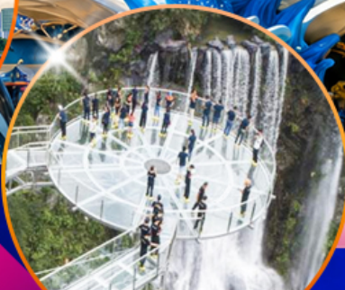
สะพานแก้วกู่หลงเซี่ยะ