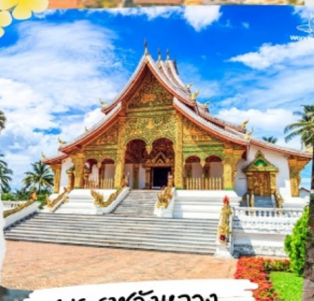
พระราชวังหลวง