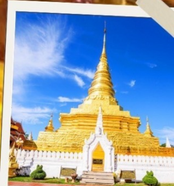
วัดพระธาตุแช่แห้ง

2 ท่านขึ้นไป 14,499 บาท/ท่าน 4 ท่านขึ้นไป 12,799 บาท/ท่าน 6 ท่านขึ้นไป 10,999 บาท/ท่าน