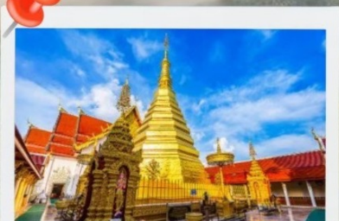
วัดพระธาตุช่อแฮ