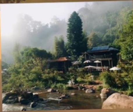
แม่บ้าน ส=ป่า