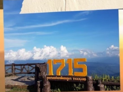
จุดชมวิวกว 1715