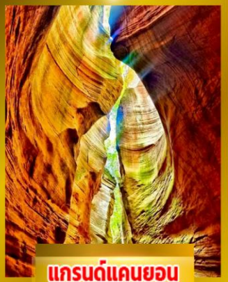
แกรนด์แคนยอน ยูวาโก