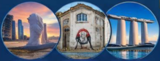
SINGAPORE PENANG SINGAPORE

SINGAPORE - PENANG - SINGAPORE 4 วัน 3 คืน