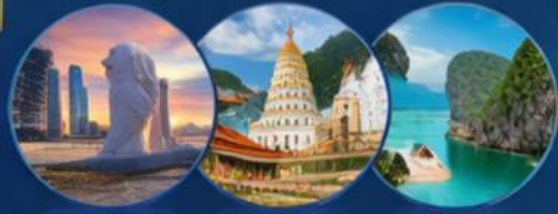
SINGAPORE PENANG PHUKET

SINGAPORE - PENANG - PHUKET - SINGAPORE 5 วัน 4 คืน