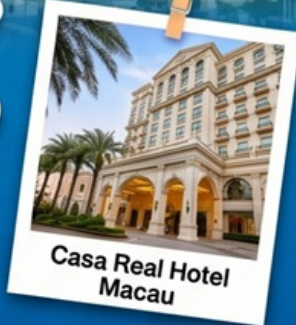
Casa Real Hotel Macau

แพ็คเกจสุดคุ้ม พักหรู 4 ดาวพร้อมอาหารเช้าที่ Casa Real Hotel Macau