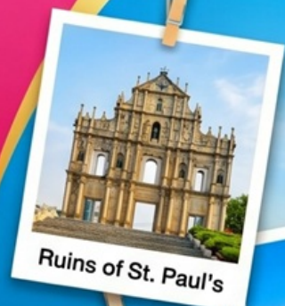
Ruins of St. Paul's