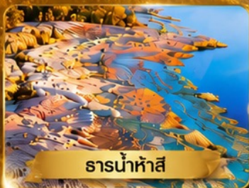
ธารน้ำห่าสี