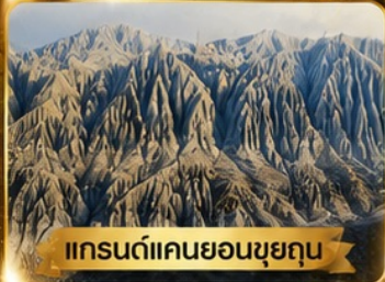
แกรนด์แคนยอนขุยคุน