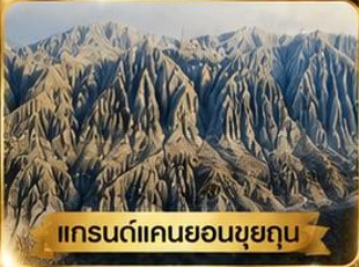
แกรนด์แคนยอนขุยถุน