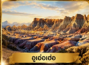
อุ่อฮ้อฮ่อ