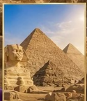
มหาพีระมิดกิซ่า