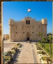
อเล็กซานเดีย