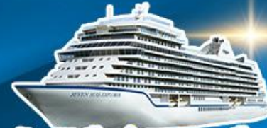
พักบนเรือสำราญ 2 คืน