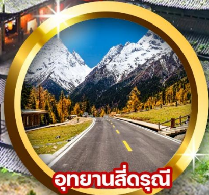
อุทยานสี่ดรุณี