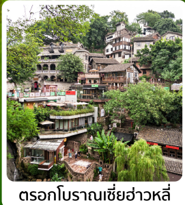
ตรอกโบราณเขี่ยฮ่าวหลี่