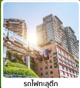
รถไฟทะเลสุดคึก

ไฮไลท์! เมืองโบราณกงถาน ล่องเรือแม่น้ำจูเจียง อุกยานถาฮวาหยอน รถไฟทะเลสุดคึก หมู่บ้านโบราณฉือชี่โข่ว ถนนคนเดินเจี๋ยฟางเป็ย