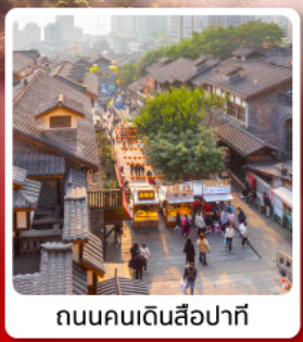
ถนนคนเดินสี่ปาตี