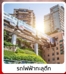
รถไฟฟ้ายักษ์

ไฮไลท์อุทยานแห่งชาติหลุมฟ้า 3 สะพานสวรรค์มรดกโลกระดับ 5 A ชมไฟยามค่ำคืนของสถาปัตยกรรมจีนโบราณ หงหยาดัง