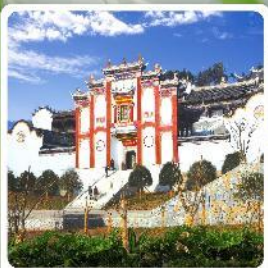
บ้านเกิดชวีหยวน