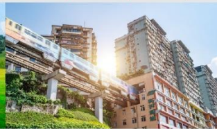
รถไฟฟ้าทะเลตุ๊ก