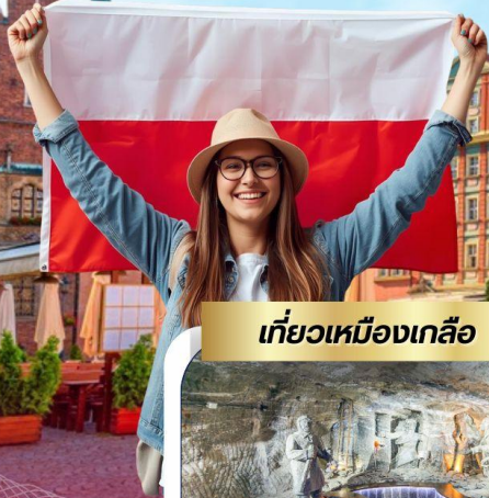
เที่ยวเหมืองเกลือ

เสน่ห์เมืองเก่าแห่งโปแลนด์ เที่ยวครบไฮไลต์ 9 วัน 6 คืน