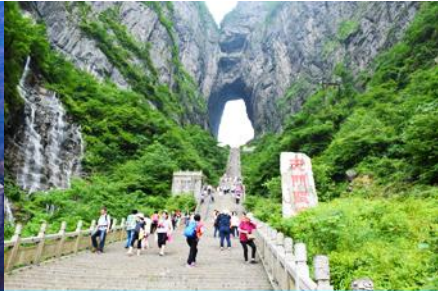
ประตูลูกเต๋ายืน