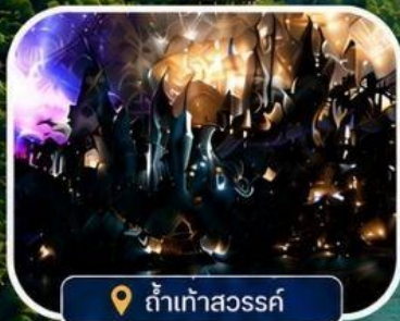
ถ้ำเก้าสวรรค์