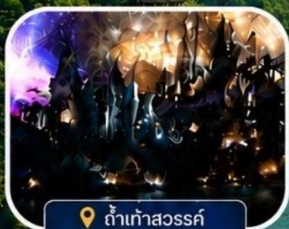
📍 ถ้ำเก้าสวรรค์ มหัศจรรย์โลกใต้พิภพ