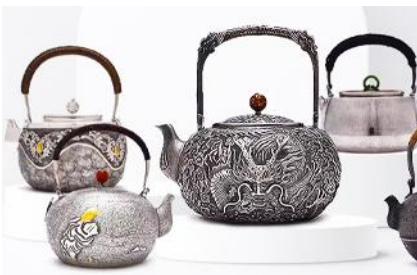
พิพิธภัณฑ์เครื่องเงินมองโกล