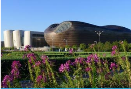
อุทยานคังปาสือ