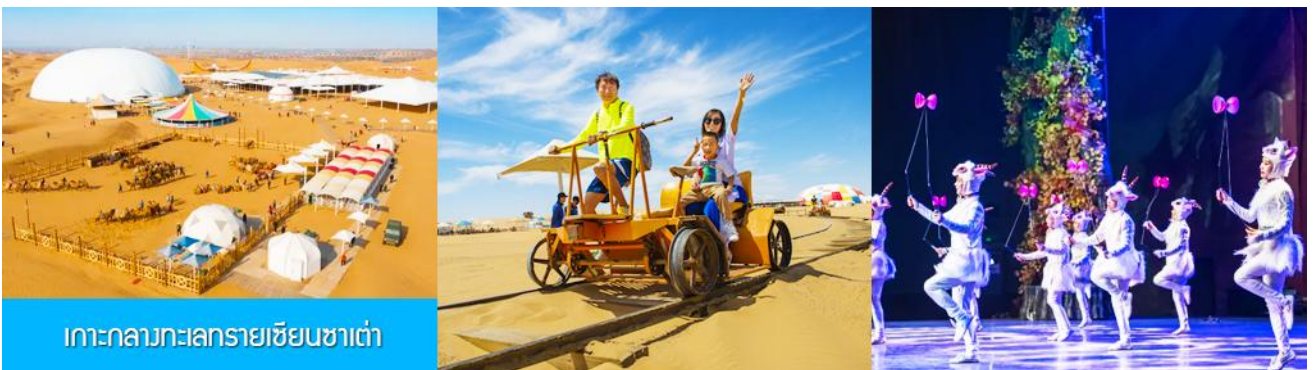
เกาะกลางทะเลทรายเซียนซาเต๋า