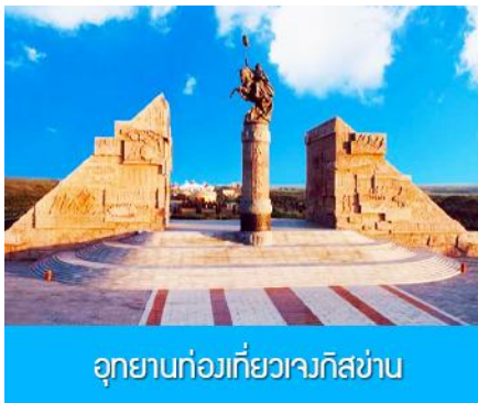
อุทยานก่อกว่ยเจกิสข่าน