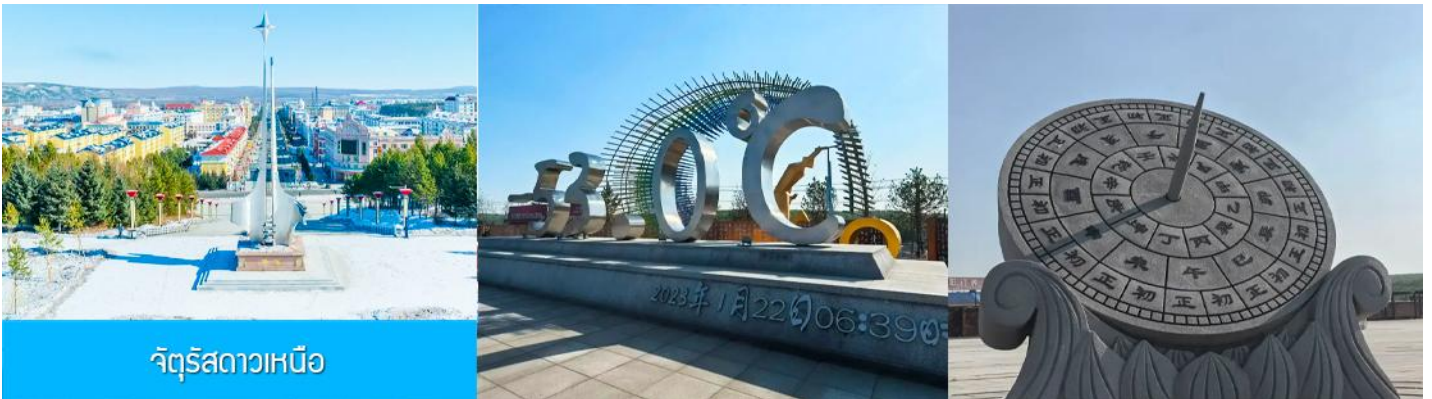
จัตุรัสดาวเหนือ