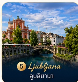
5 Ljubljana ลูบลิยานา