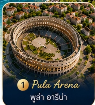
1 Pula Arena พูลา อารีน่า