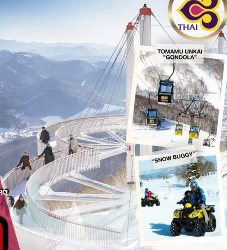
TOMAMU UNKAI "GONDOLA"