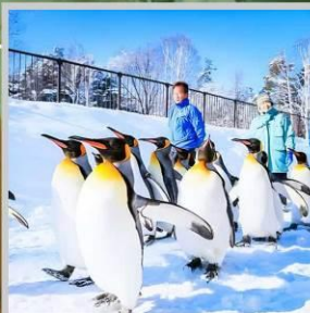
“PENGUIN ASAHIYAMA ZOO”