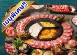
ซูฟไฟ้ชบาย