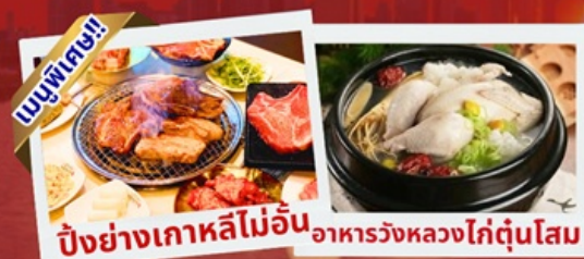
ปิ้งย่างเกาหลีไม่อื่น อาหารวังหลวงไก่ตุ๋นโสม

เชคอินห้องสมุดสุดอลังการ ชมศิลปะดิจิทัลสุดล้ำ บนจอ LED เสมือนจริงขนาดยักษ์ หมู่บ้านเกาหลีโบราณบุกซอน อันอก อิสระซ็อบปัง 2 ย่านดัง ซองซู เมียงดง ซ็อบปลาอคาซี Lotte Duty Free