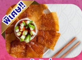
เปิดปีกกึ่ง